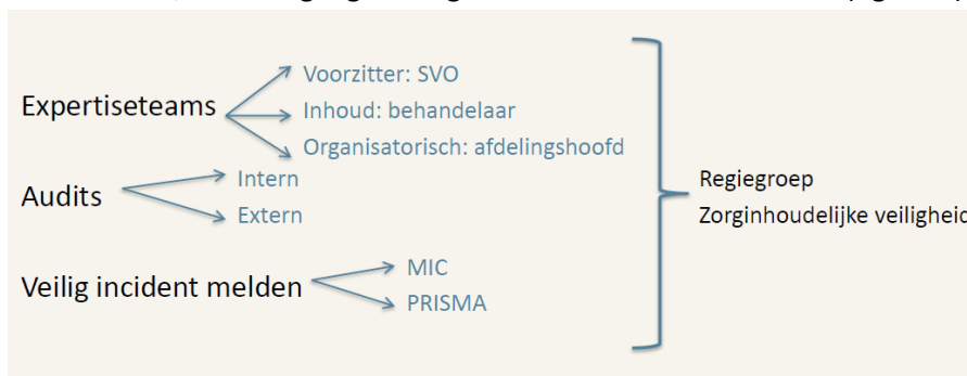
Figuur 2: werkwijze regiegroep zorginhoudelijke veiligheid Zinzia Zorggroep

Resultaten uit audits en VIM worden rechtstreeks naar leidinggevend en teams doorgezet, zodat daar direct acties en verbeteringen ingezet kunnen worden. Om daarnaast Zinzia-breed overzicht te houden op de voortgang worden alle gegevens verzameld, geanalyseerd en besproken in de Zinzia regiegroep zorginhoudelijke veiligheid. Hierin zitten de regiomanager, manager expertise- en behandelcentrum, specialist ouderengeneeskunde, SVO en een senior adviseur kwaliteit en innovatie. De regiegroep houdt zicht op risico's m.b.t. zorgveilig werken binnen Zinzia, de voortgang van ingezette acties en het resultaat (figuur 2).